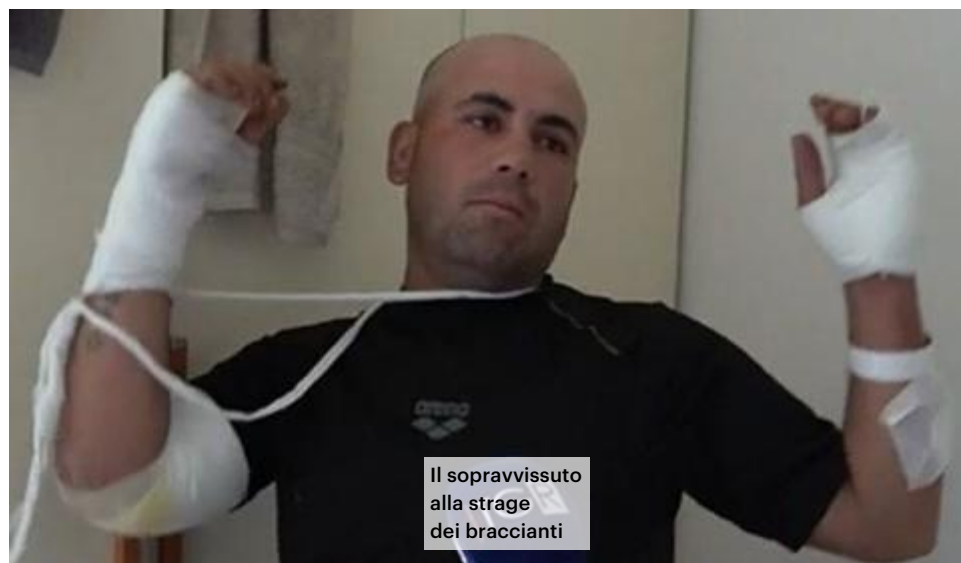
Il sopravvissuto alla strage dei braccianti