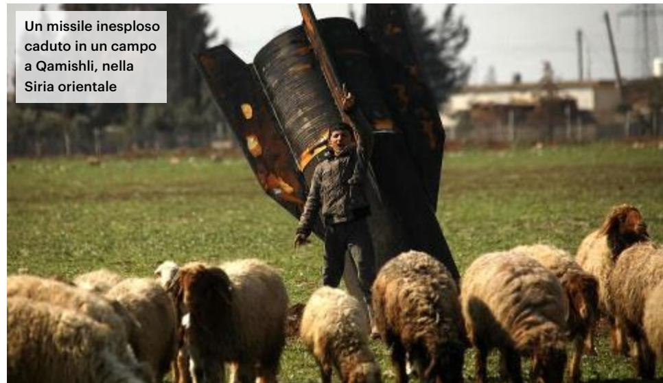
Un missile inesplosivo caduto in un campo a Qamishli, nella Siria orientale