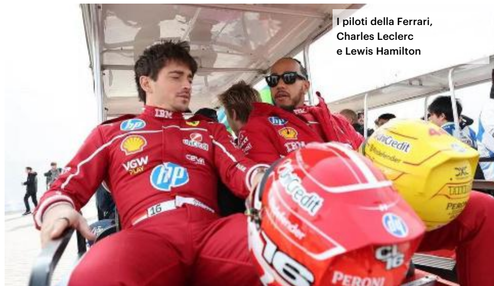
I piloti della Ferrari, Charles Leclerc e Lewis Hamilton