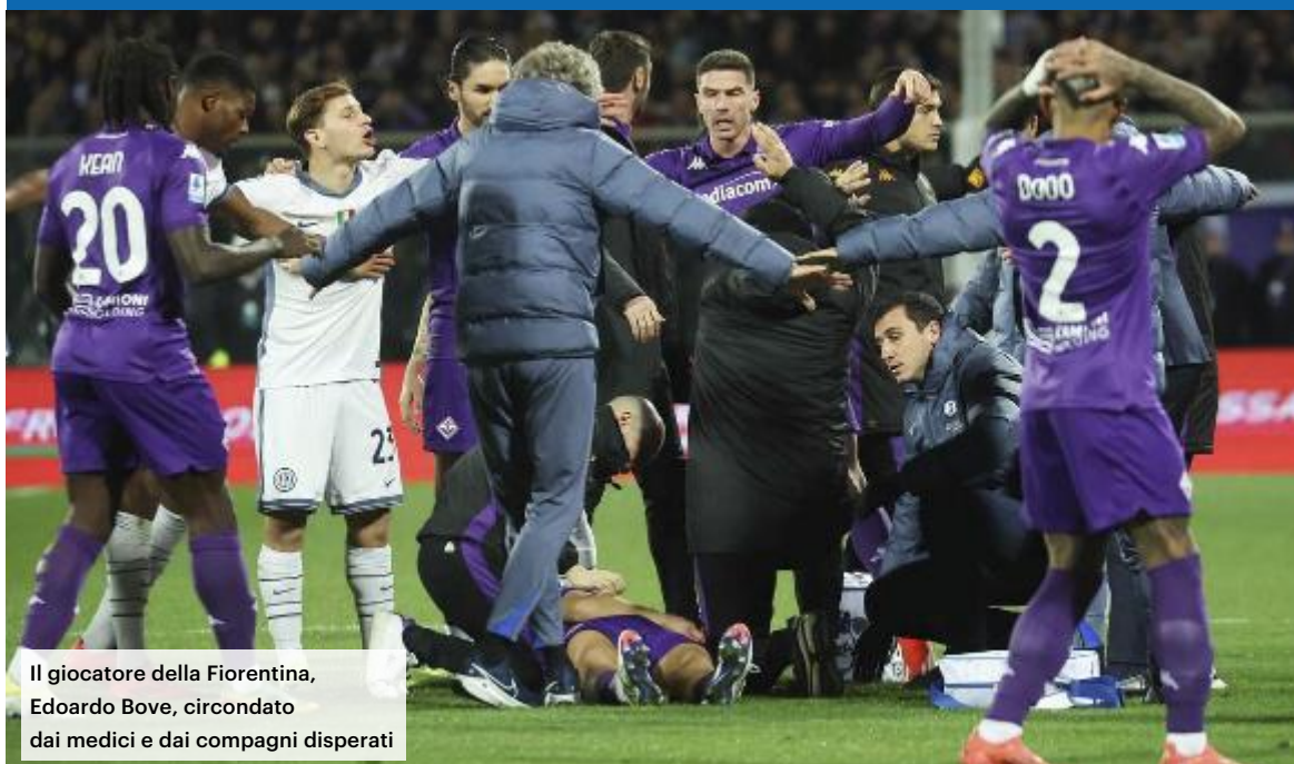
Il giocatore della Fiorentina, Edoardo Bove, circondato dai medici e dai compagni disperati

IL CALCIATORE 22ENNE SI ACCASCIA DURANTE FIORENTINA-INTER CORSA IN OSPEDALE: È IN TERAPIA INTENSIVA. GARA RINVIATA